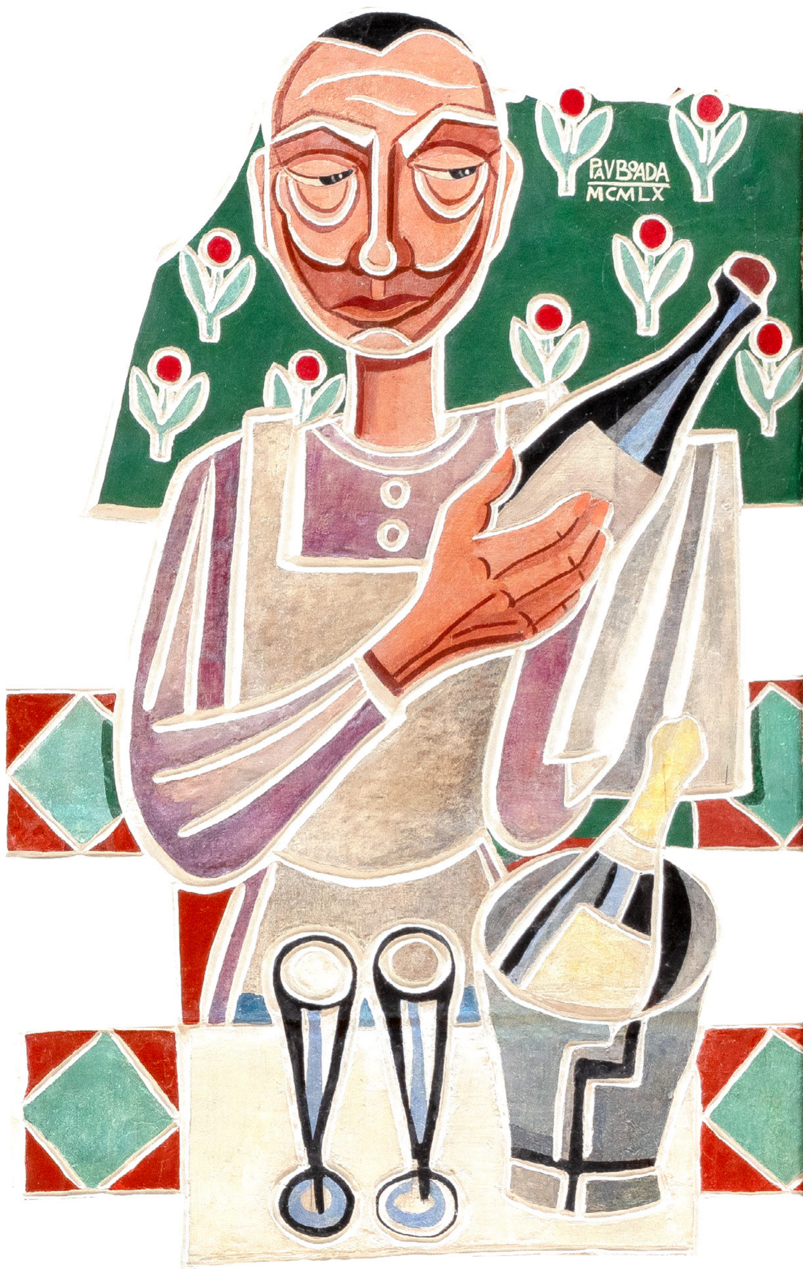
Mural de la vinya i el vi (fragment). Pau Boada, 1960. VINSEUM.

7 — 17.11 Penedès 27.11 — 1.12 Priorat 2024 mostfestival.cat